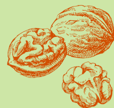
fruits à coques